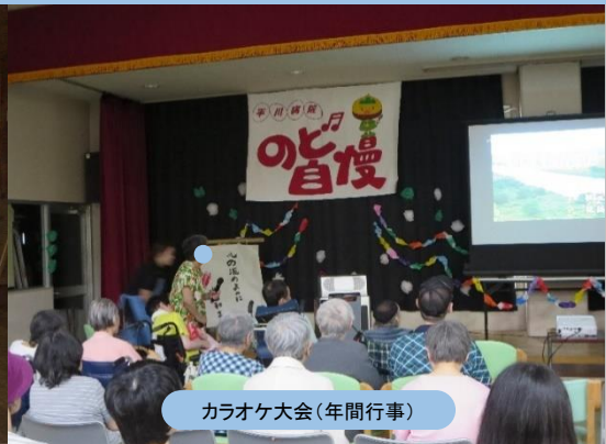
カラオケ大会(年間行事)