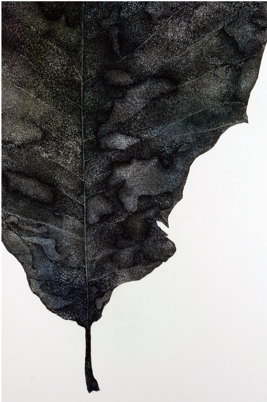
杉本 たまえ 『侵蝕』(部分) ペン、水彩 100.3×72.5 cm 侵蝕年 2014～2023年