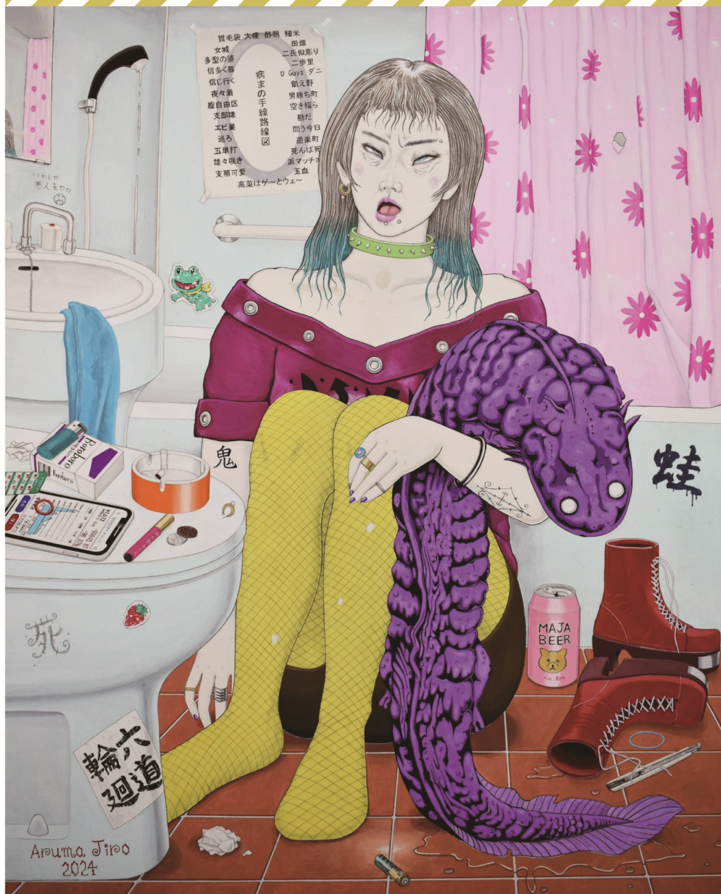
或馬 次郎『鬱』水彩 100×80.3 cm

今回の会場は「八王子市中央図書館」になります。 「いちようホール」ではありません。