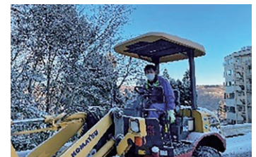
大雪時の除雪作業

修理や改修を行った設備が、安全に問題なく使用されているのを見ると、大きなやりがいを感じます。