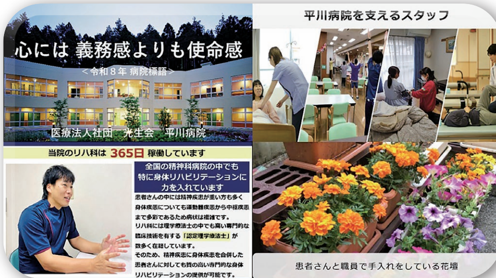
掲載内容の一部を抜粋

今後も内容の充実を図り、地域の皆さまにとって身近で信頼される医療機関であり続けられるよう、努めてまいります。ご来院の際にはぜひご覧ください。