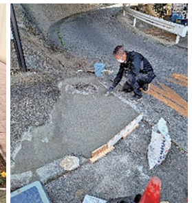
左官作業もお任せ