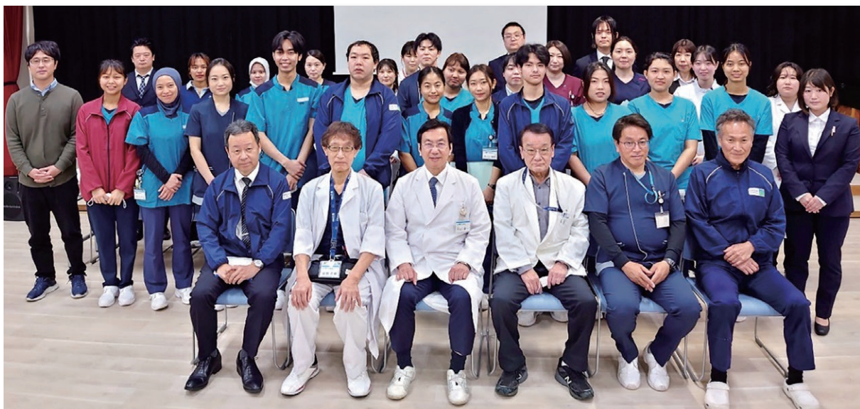
新入職員オリエンテーションでの集合写真