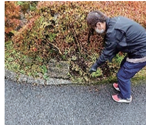
花壇の修繕や照明交換等病院スタッフの強い味方

車椅子、ベッド、照明、鍵など、院内で日常的に使用する設備について、修理伝票に基づき修繕対応を行います。修理可能なものは修繕し、困難な場合は新規購入・設置を行います。また、突発的な故障への対応も担当しています。