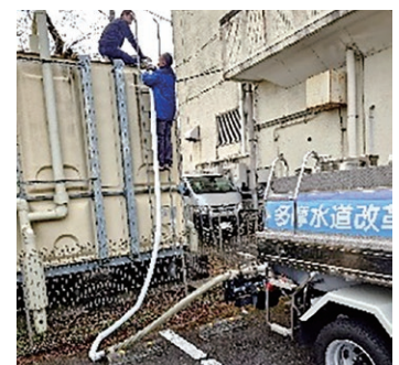
断水時給水の手伝い

改修計画を検討している最中に突発的な故障が発生したり、夜間対応が必要になったりすることがあり、その点が大変です。